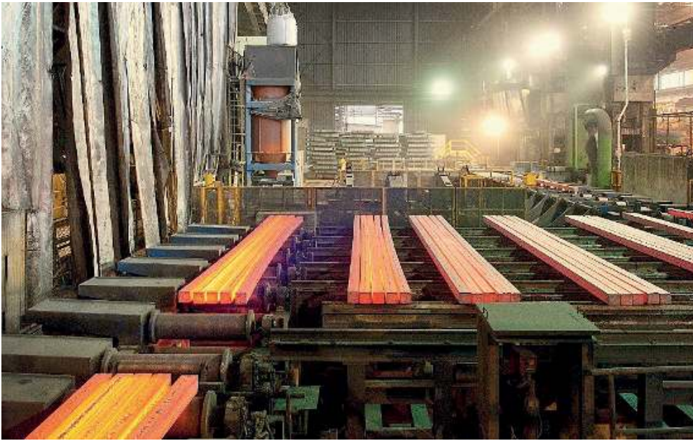
Il sito di Odolo. Uno scorcio dello stabilimento della Ferreria Valsabbia