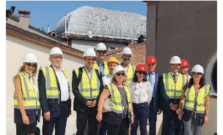
La delegazione. I monegaschi ieri a Corte Sant'Agata